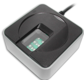
DigiScan Advanced FS 88H